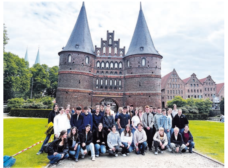
Gruppenbild mit allen Teilnehmenden vor dem Holstentor, dem Wahrzeichen von Lübeck.