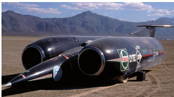
Das Raketenauto ThrustSSC wurde in Großbritannien gebaut.

Rennfahrer oder Rennfahrerinnen müssen blitzschnell reagieren und ihr Auto perfekt