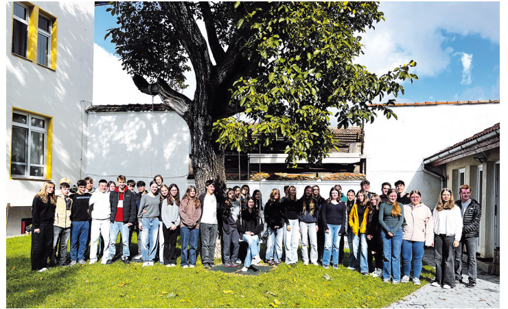
Gruppenbild im Innhof des Erholungsheims in Wolkendorf.